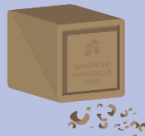
Savon de Marseille